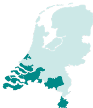
■ Regio's CZ zorgkantoor

U kunt voor zorg terecht bij verschillende instanties: uw zorgverzekeraar, een zorgkantoor of gemeente. Zoekt u ondersteuning of wilt u weten hoe u de zorg kunt regelen voor u zelf of iemand anders? Ga naar: www.cz-zorgkantoor.nl/hulpwijzer-wlz en ontvang een persoonlijk stappenplan en tips.